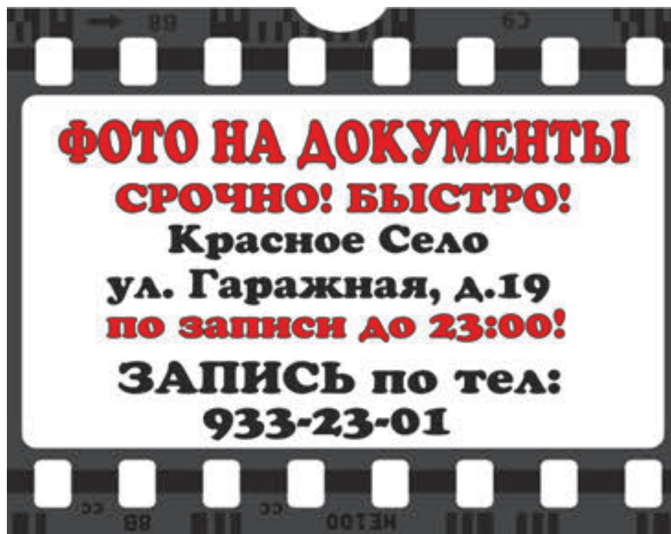
ФОТО НА ДОКУМЕНТЫ СРОЧНО! БЫСТРО!